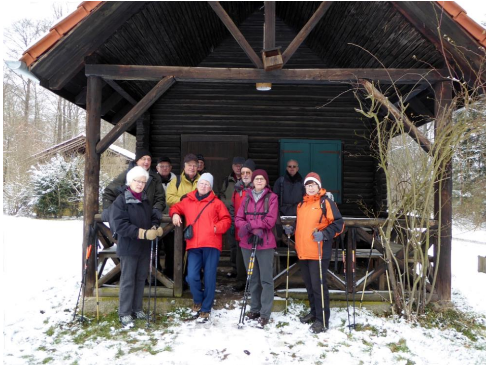
Vesperpause an der Jägersitzhütte

Im gemütlichen Vorbau der Jägersitzhütte verzehrten wir zum Mittag unser Rucksackvesper.