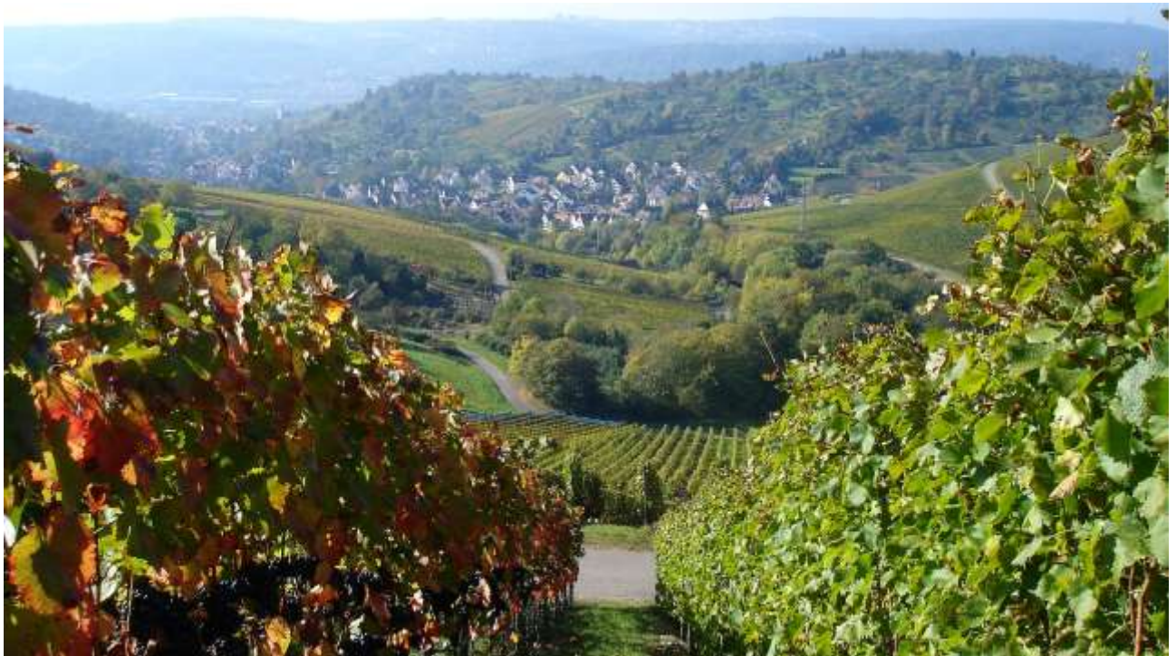
Blick vom Götzenberg nach Uhlbach

Bei der Mittagseinkehr in der Waldschenke Sieben Linden stärkten wir uns bei gutem Essen und Getränken für den Abstieg nach Uhlbach und die abschließende Wegstrecke zur Petruskirche und weiter nach Untertürkheim.